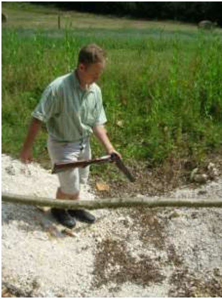
Il franchit le fossé, arme ouverte et déchargée.