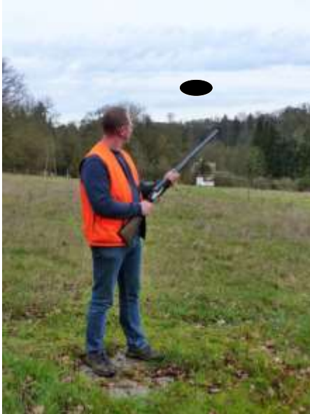
Direction maison Non tirable

L'ordre de départ des plateaux (tirables / non tirables) est aléatoire. Le candidat ne doit pas bouger quand le plateau non tirable est lancé.