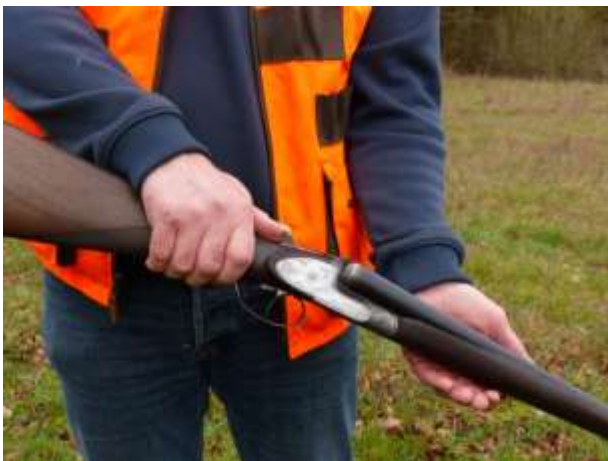
Ouverture du fusil

Si le candidat est amené à tirer, il respectera les mêmes consignes qu'en début de parcours (choix d'une zone de sécurité par un coup d'œil et manipulation dans cette zone, ouverture du fusil en abaissant la crosse, canons en bas, vérification des canons après chaque tir, fermeture en relevant la crosse).