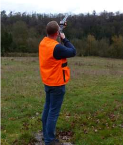
Vérification des canons