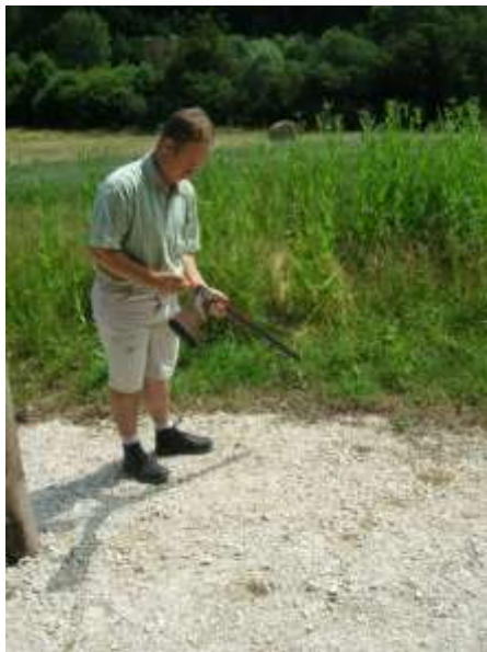
Il introduit les cartouches dans les chambres et referme l'arme en relevant la crosse.