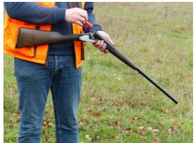
Extraction des cartouches