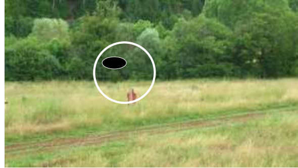
Plateau en direction de la silhouette pivotante