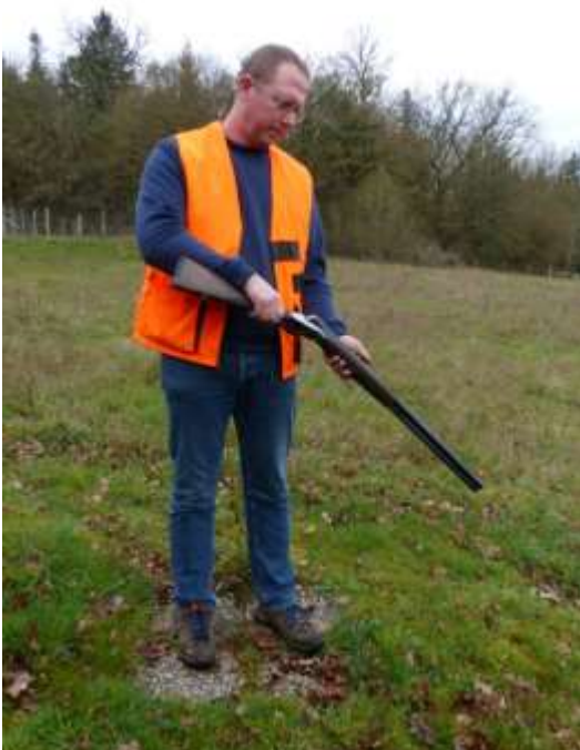
Fermeture de l'arme