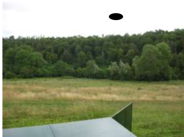
Direction coteau Tirable

Si le candidat est amené à tirer, il respectera les mêmes consignes qu'en début de parcours (choix d'une zone de sécurité par un coup d'œil et manipulation dans cette zone, ouverture du fusil en abaissant la crosse, canons en bas, vérification des canons après chaque tir, fermeture en relevant la crosse).