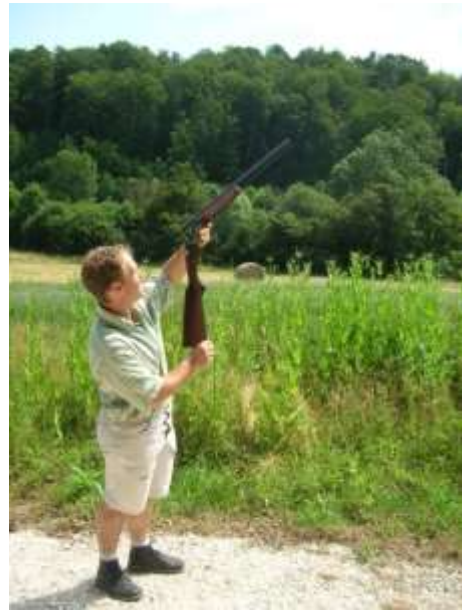
Il choisit sa zone sécurisée et regarde l'intérieur des canons avant de recharger.